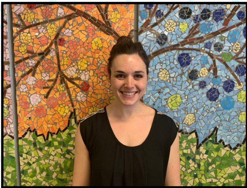
Mme Myriam Maternelle 4 ans